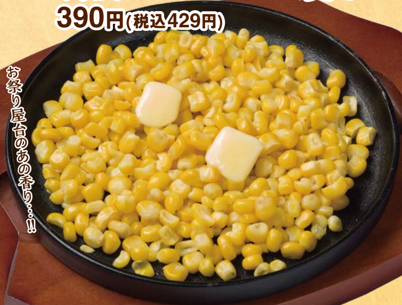
No.167 鉄板コーンバター焼き 390円(税込429円)