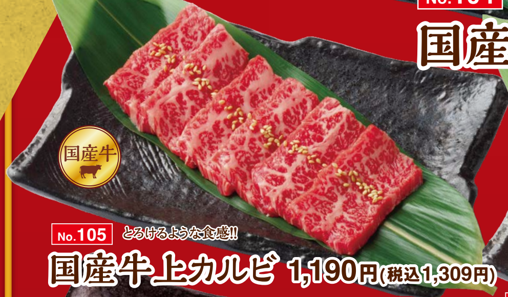
No.105 とろけるような食感!!