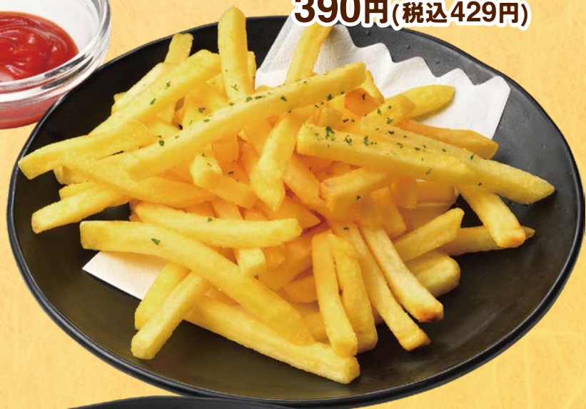
No.168 ポテトフライ 390円(税込429円)