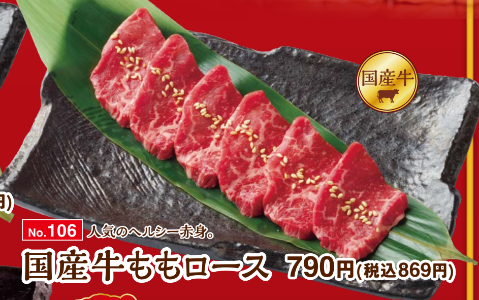
No.106 人気のヘルシー赤身。