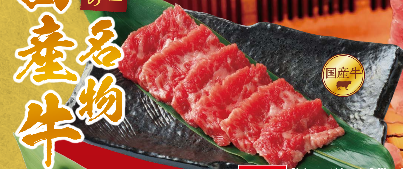
No.104 旨さにこだわった自慢の名物!!