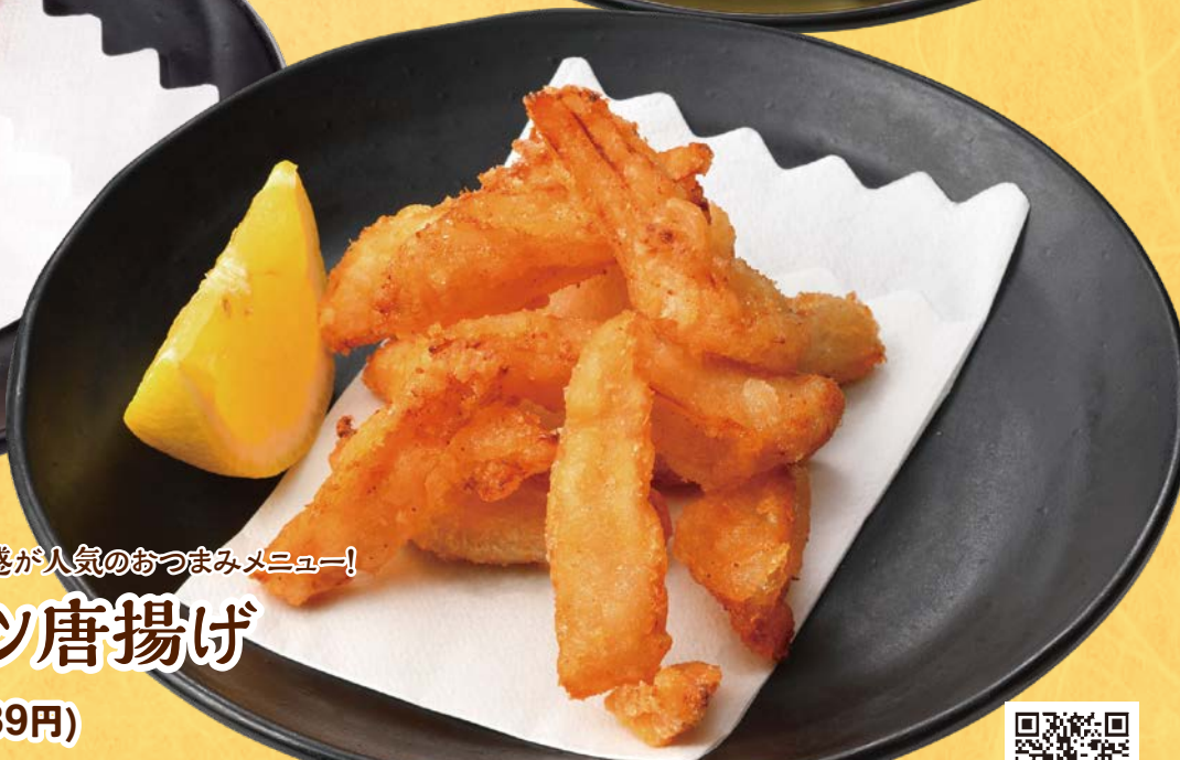
No.170 鶏ナンコツ唐揚げ 490円(税込539円)