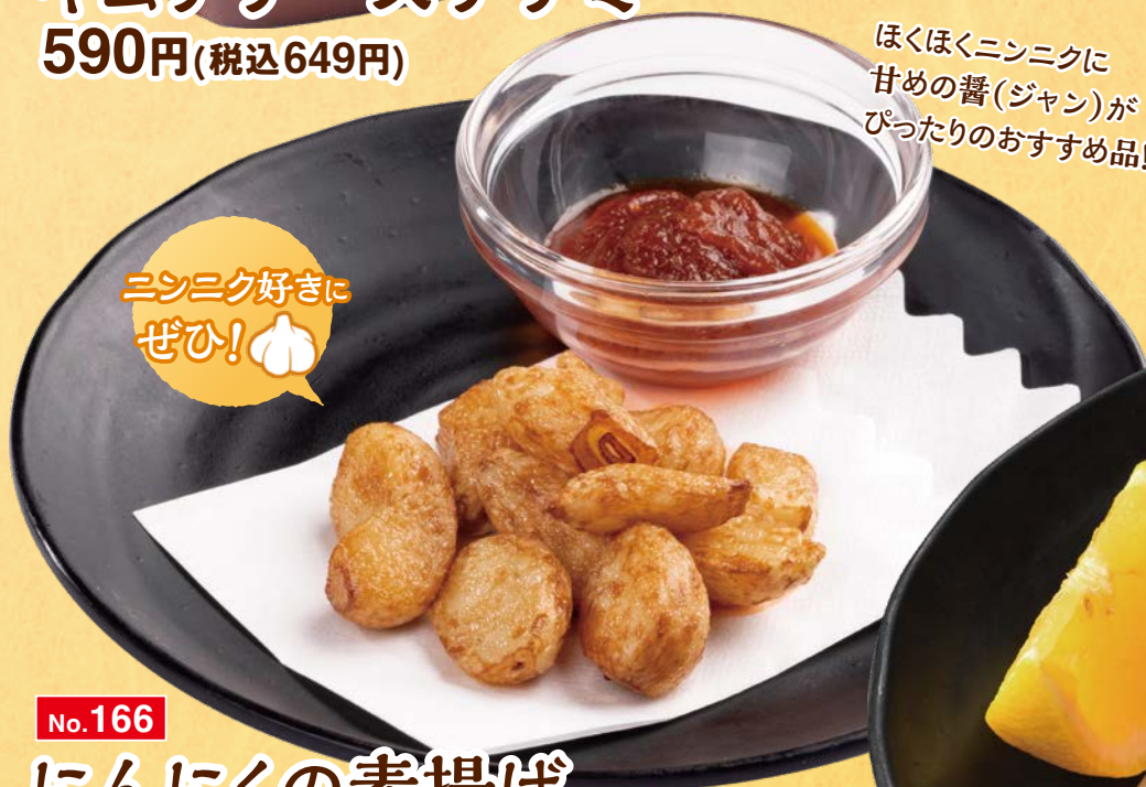
No.169 キムチチーズチヂミ 590円(税込649円)